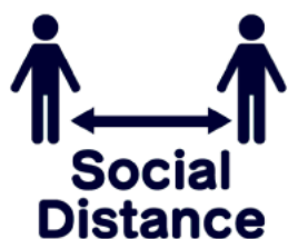
ソーシャルディスタンスの確保