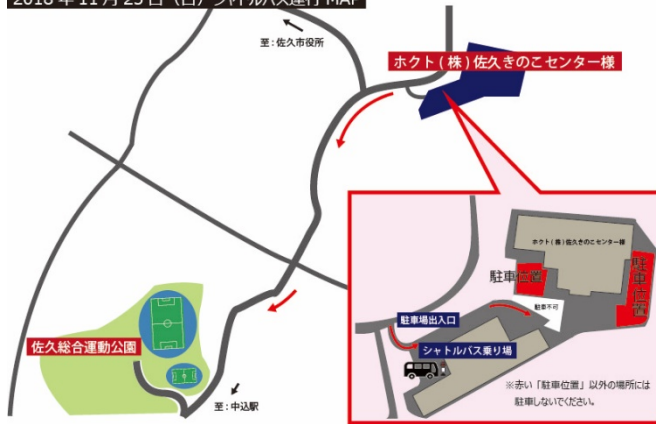
2018年11月25日（日）シャトルバス運行MAP

11/25(日)につきましては、競技場隣接駐車場の混雑が予想される為、第二試合【AC長野 vs 武庫川大】（13:30）の試合に合わせてシャトルバスを運行いたします。是非「ホクト(株)佐久きのごセンター様」臨時駐車場と併せてご利用ください。